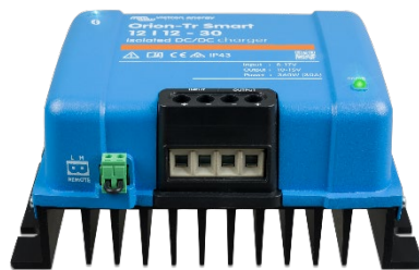
Orion-Tr Smart 12/12-30