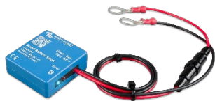
Bluetooth-Erkennung Smart Battery Sense