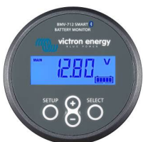
Bluetooth-Erkennung BMV-712 Smart Battery Monitor