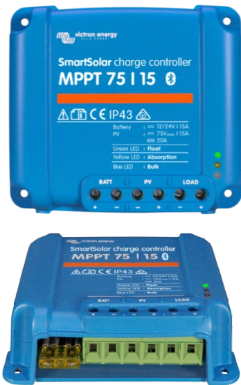
SmartSolar Lade-Regler MPPT 75/15